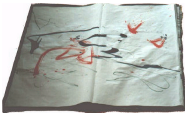
Tonie Meilhamer/ Gruppe SOMPH „Großes Gaglbuch“ - Aktionsbuch zur Eröffnung der 1. Germeringer BUCH-KUNST-ACHSE 1997

Ich weiß noch, wie ich in eine tiefe Krise stürzte, weil ich merkte, dass