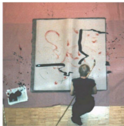
Aktion anlässlich der Künstler-Buchausstellung in der Stadtbibliothek Germering